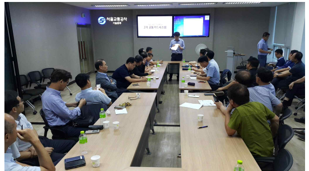
<전자처장 - 맺은말 등>