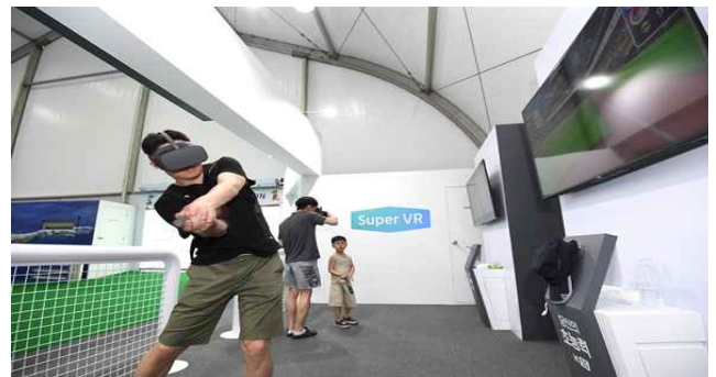
< VR 야구 >