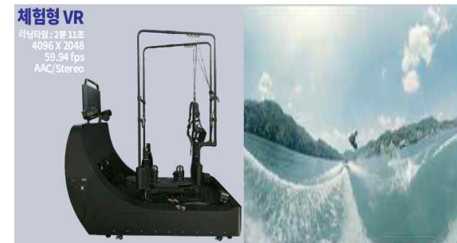
< VR 웨이크보드 >