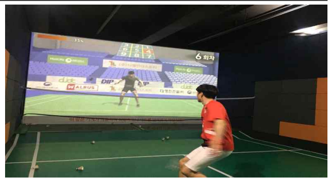
< MR 배드민턴 >