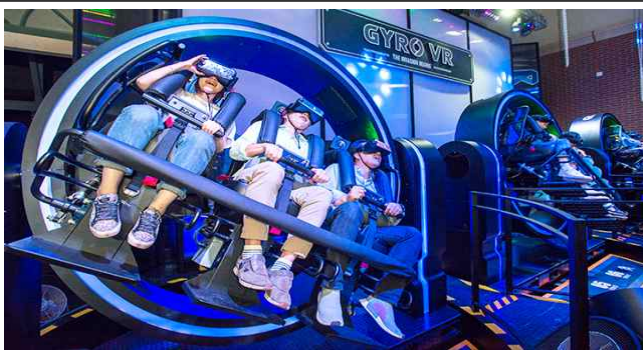
< 자이로 VR >