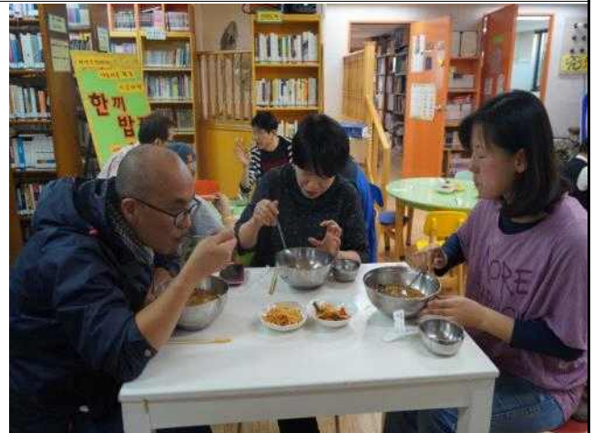
〈일반 시민대상 밥집 운영중〉