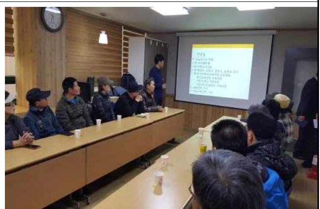
<나눔이웃 교육 진행중>