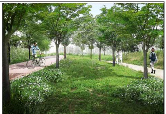
한강숲 조성 조감도