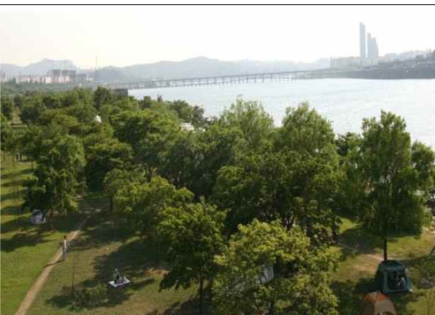
한강숲 조성 후