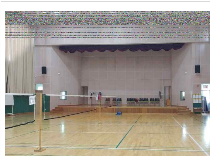
< 대강당 >