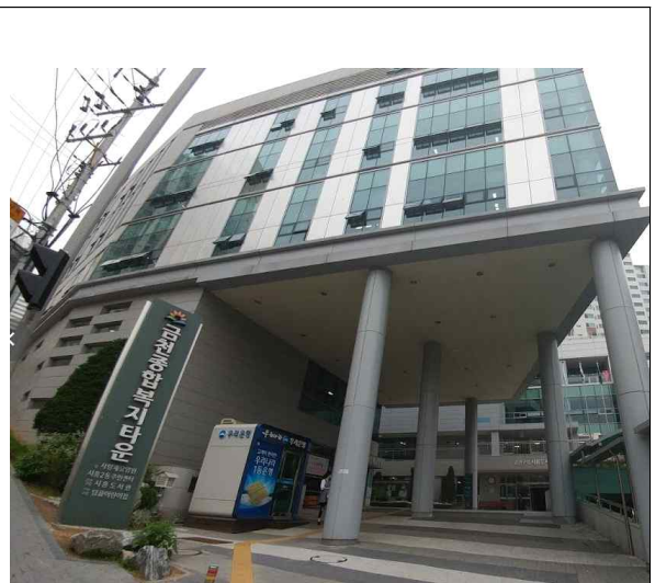
< 건물전경 >