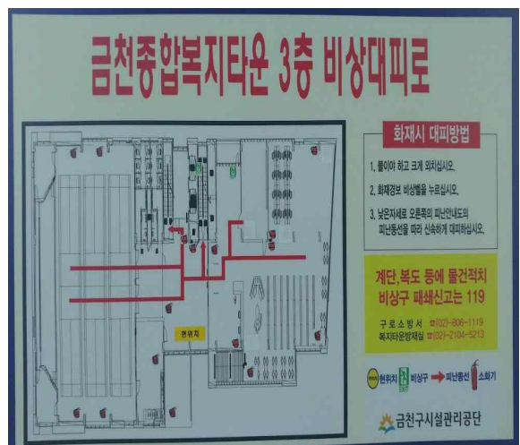
< 비상대피로 >