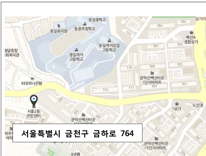
< 지도 >