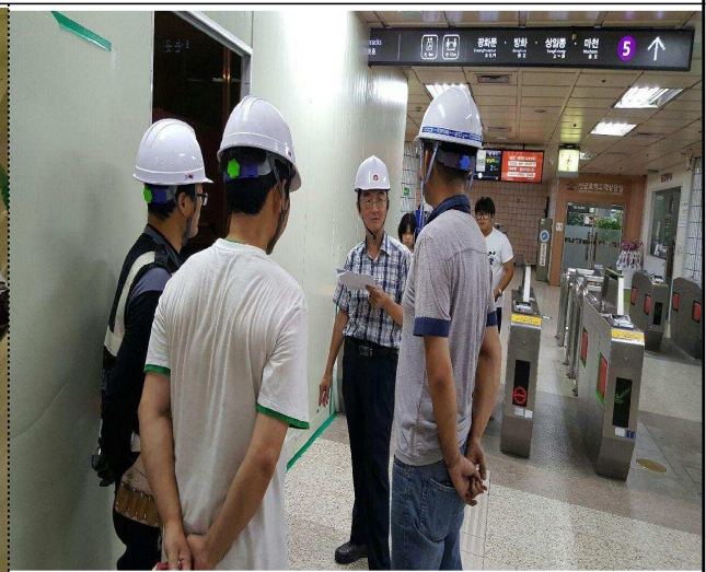
<공사현장 직원 의견청취>