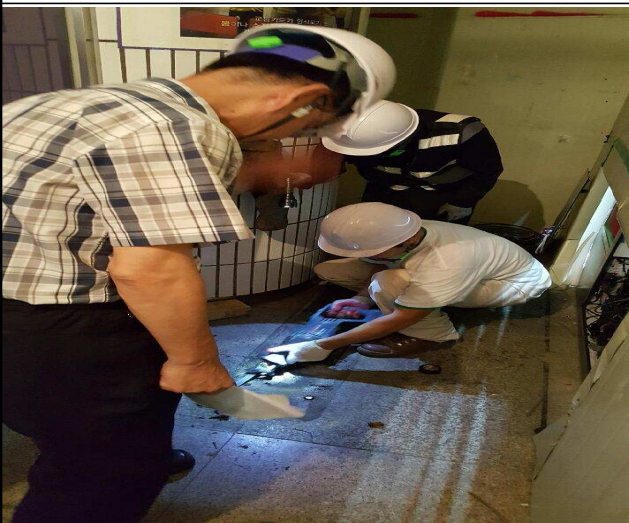
<전자 설비 이설 현장>