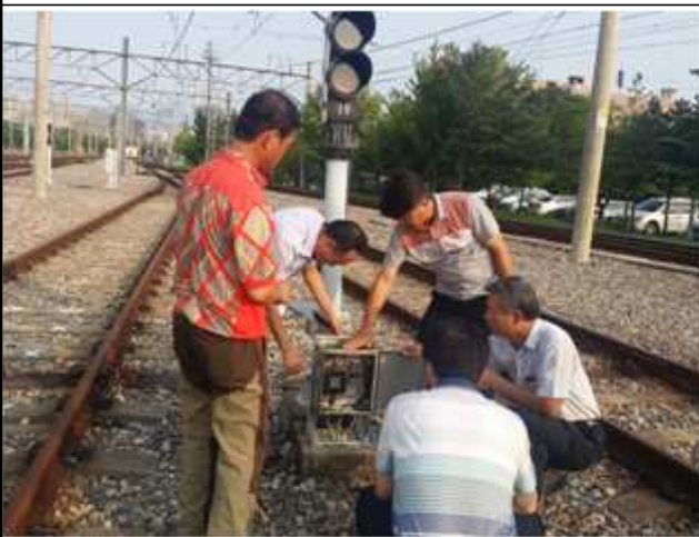
<고덕기지 신호기 관리상태 점검>