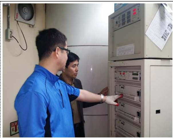
<전원장치 동작 및 유지관리상태 점검 >