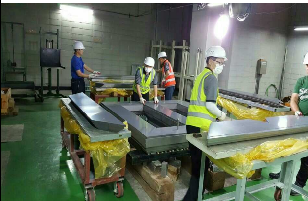
정류기용 변압기 코어조립 1