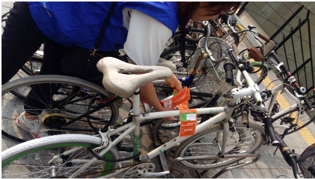
(건대입구역 4번 출구) 방치자전거 적발