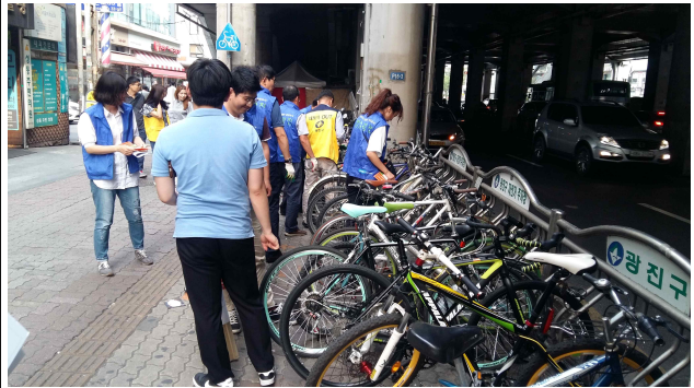
(건대입구역 1번 출구) 무질서 자전거 정리