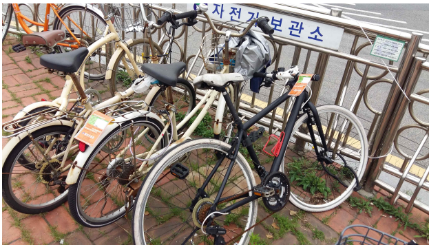
(어린이대공원역 5번 출구) 방치자전거 적발