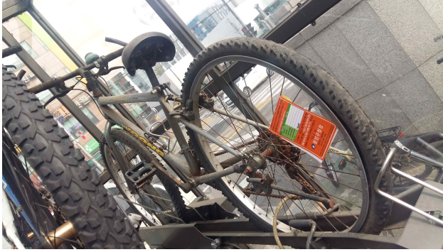
(중곡역 3번 출구) 방치자전거 적발