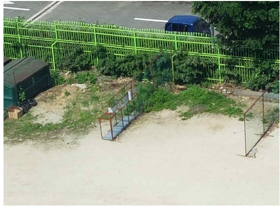
후정 쓰레기 분리 수거장