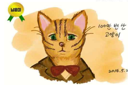
<남윤미 - 100만 번 산 고양이>