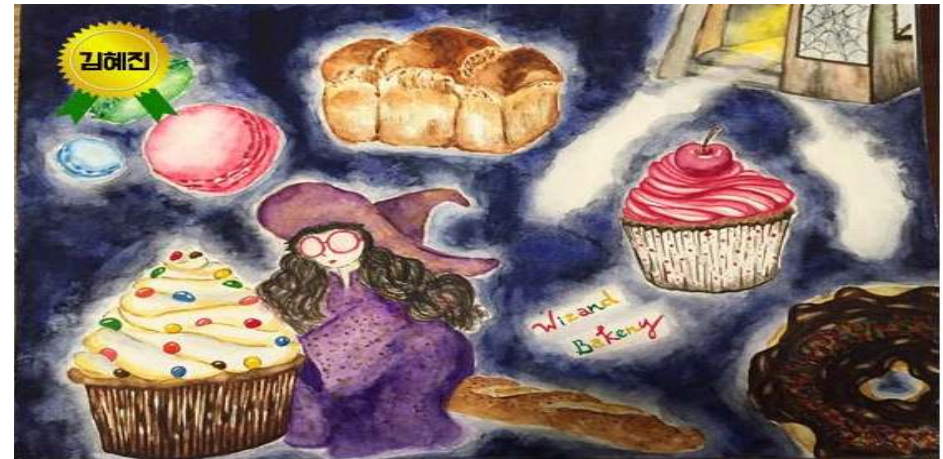
<김혜진 - 위저드 베이커리>