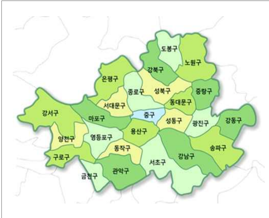
<그림 1-2> 서울특별시 교통안전기본계획의 공간적 범위