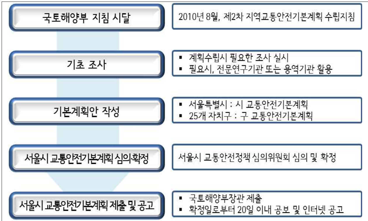
<그림 1-3> 서울특별시 교통안전기본계획의 수립절차