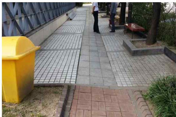
본사 서측 보행로(산책로)