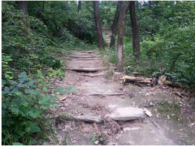
군부대 주변~운산약수터 : 산책로 정비