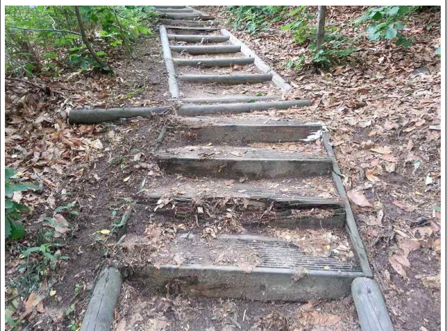
유아숲체험장 주변 : 산책로 정비