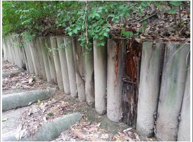
군부대 주변~운산약수터 : 축대목 정비