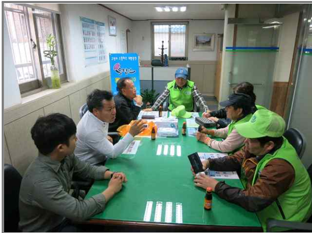
주민대표 사전 회의