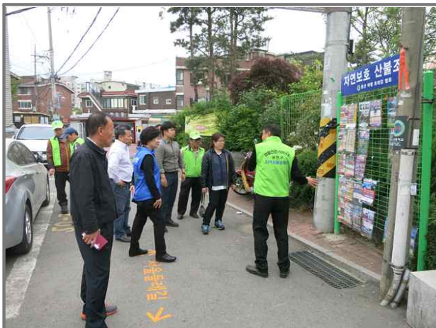
아차산 등산로 환경 점검