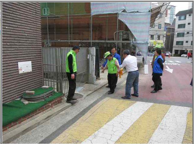
쓰레기 상습 무단투기 구역 순찰