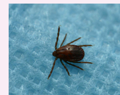
작은소피참진드기 암컷, 비흡혈 상태