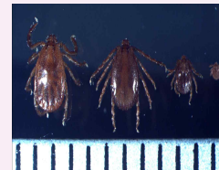
작은소피참진드기 암컷, 수컷, 약충, 유충 순서 (눈금한칸: 1mm)