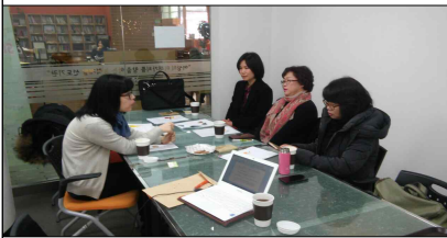
되살림 협동조합(2016. 3. 11.)