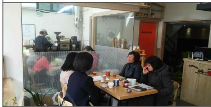
되살림 협동조합(2016. 3. 17.)