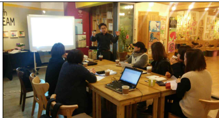
함께누리 협동조합(2016. 3. 2.)