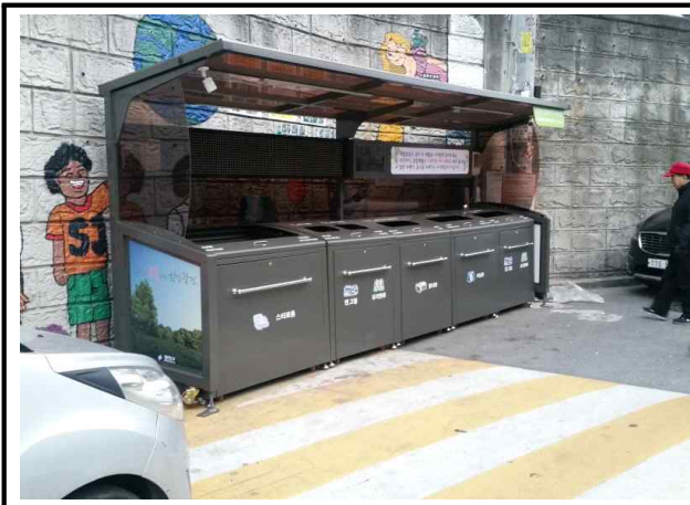
군자동 372-1 앞 세종대 담벼락