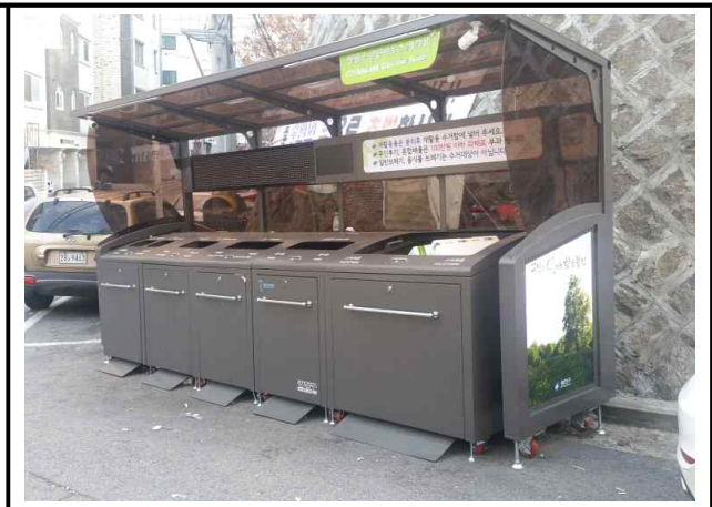
중곡3동 170-2 앞 변전소 담벼락