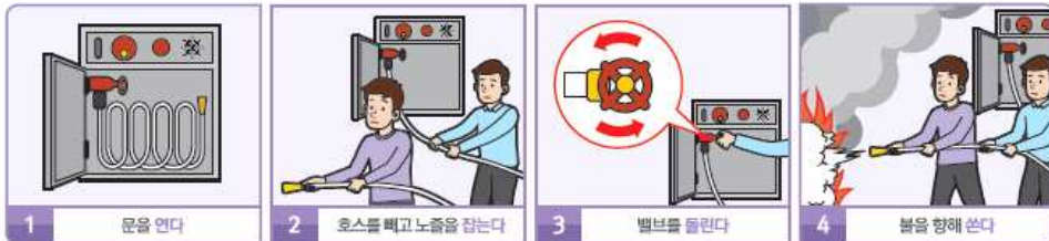
1 문을 연다 2 호스를 빼고 노즐을 잡는다 3 밸브를 돌린다 4 불을 향해 쓴다