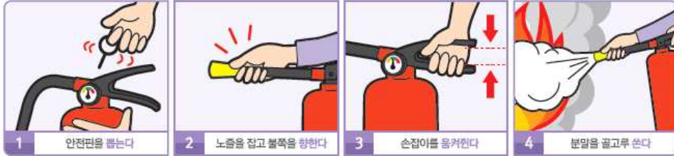
1 안전핀을 뽑는다 2 노즐을 잡고 불쪽을 향한다 3 손잡이를 움켜쥜다 4 분말을 골고루 쓴다