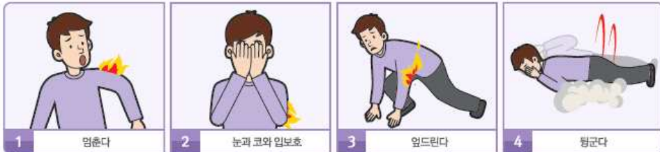
1 멈춘다 2 눈과 코와 입보호 3 엎드린다 4 뒹군다