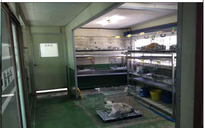
동물병원 내 입원장