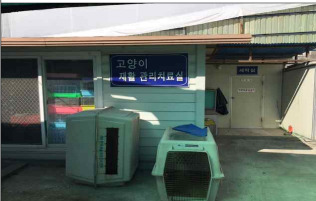
개 포획틀 및 고양이 재활 관리 치료실