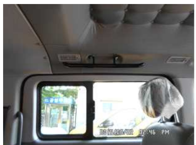
손잡이 및 천정부