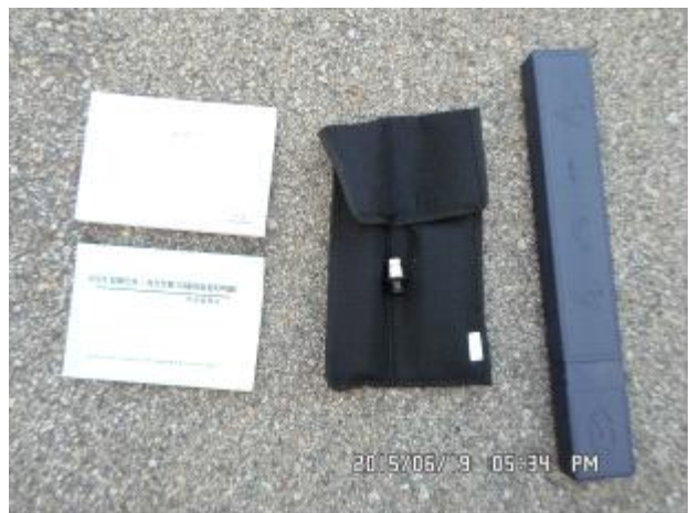
취급설명서 및 기본공구