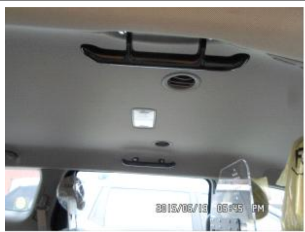
손잡이 및 천정부