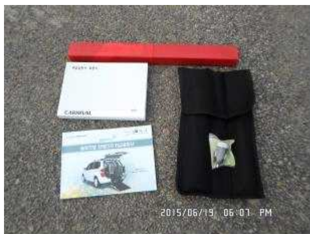
취급설명서 및 기본공구