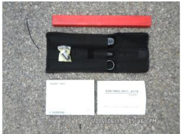
취급설명서 및 기본공구