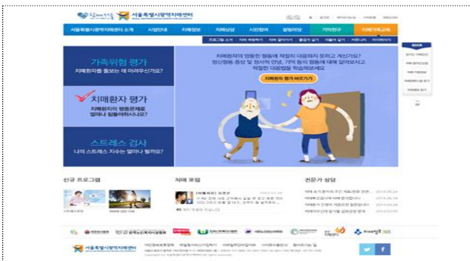
치매 환자 평가