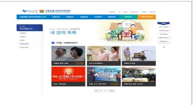
내 강의 목록