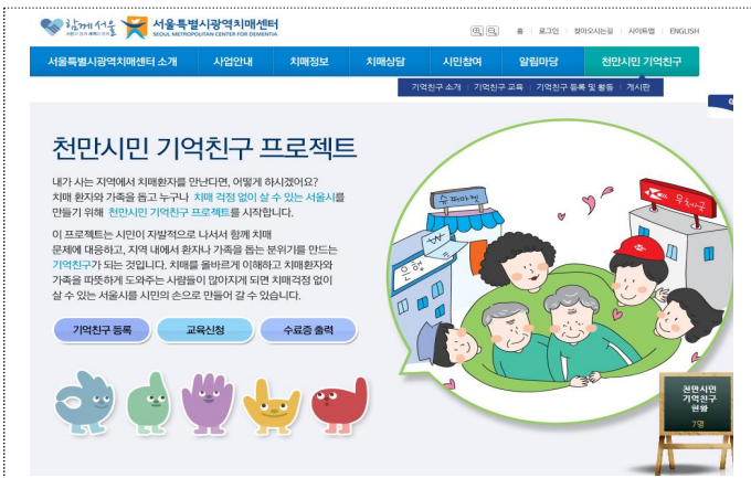
기억친구 프로젝트 소개