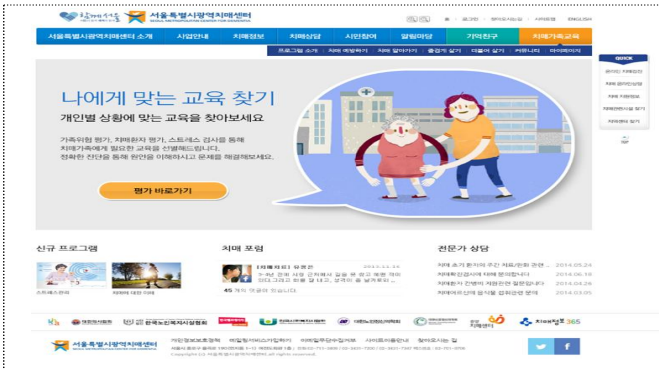
나에게 맞는 교육 찾기