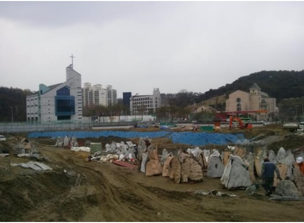
□ 1호 근린공원