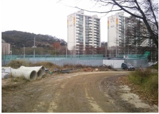
□ 1호 근린공원(문화재 임시보관소)