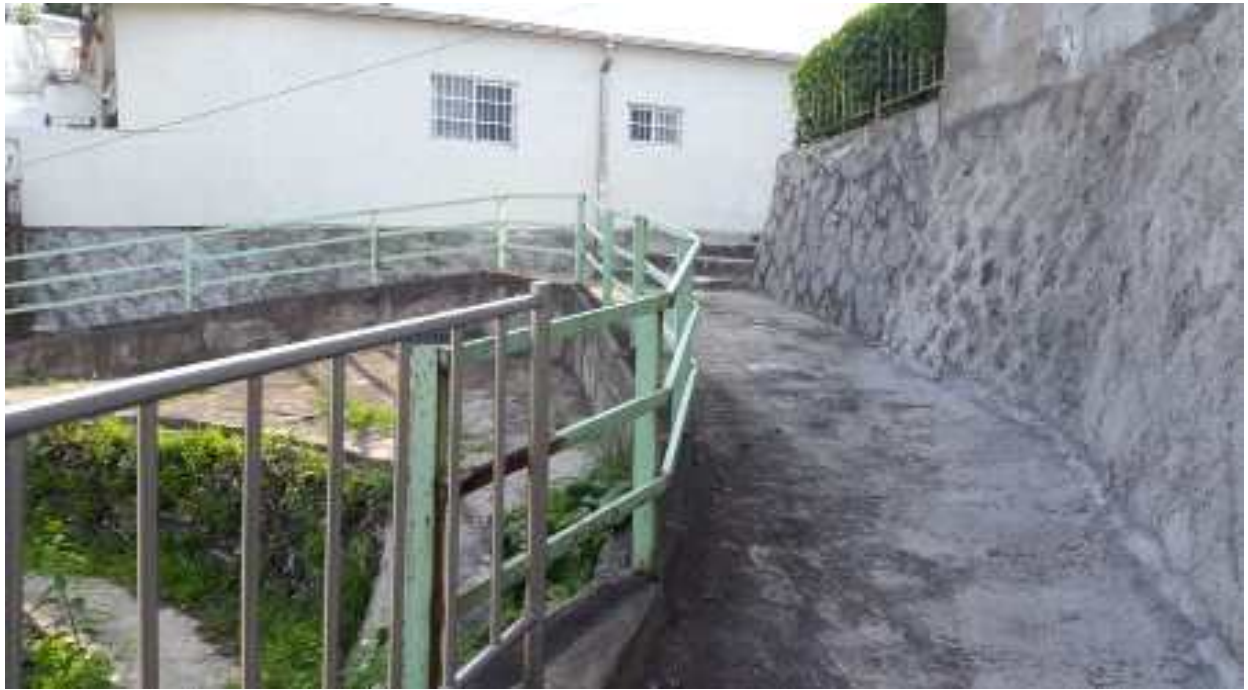
연번 3 : 정릉동 710번지 주변