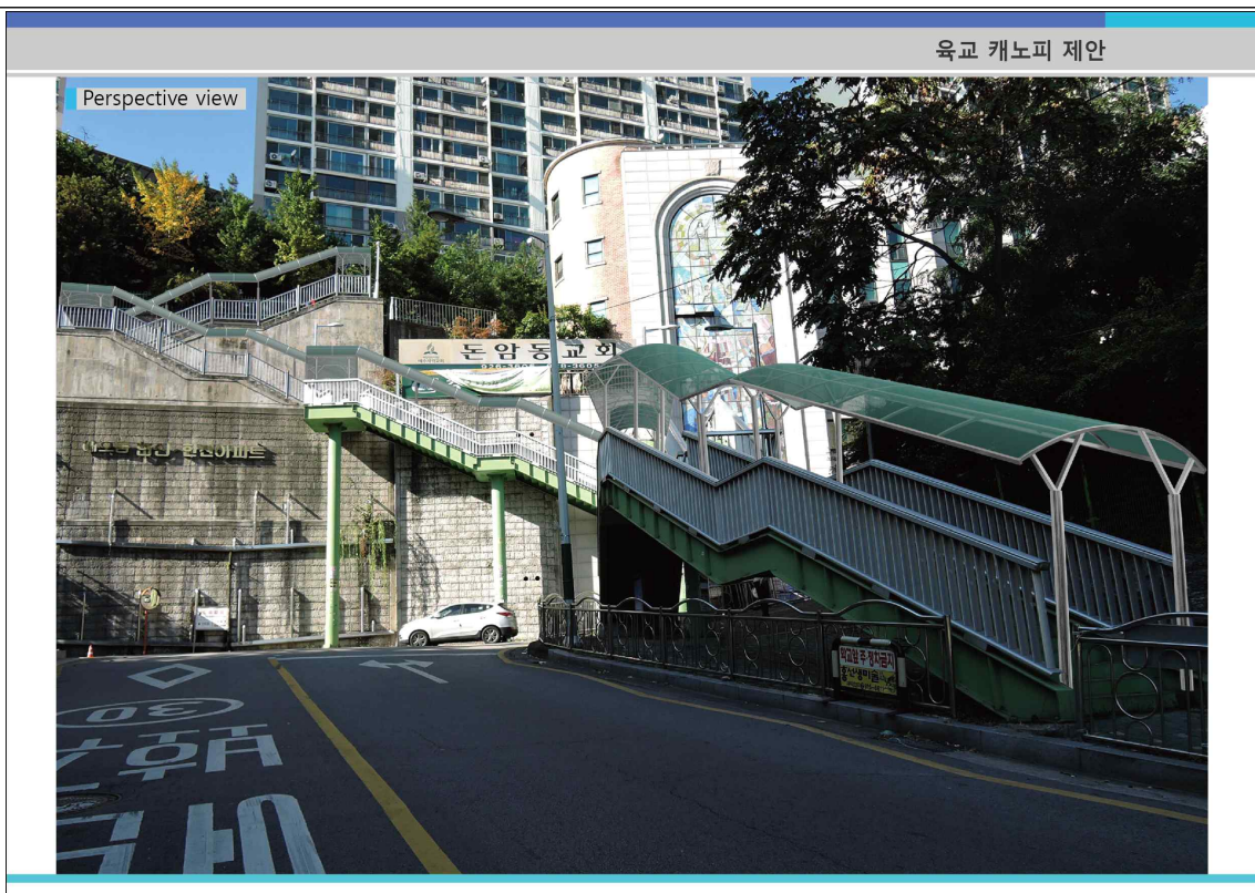
연번 4 : 돈암초등학교 육교 주변