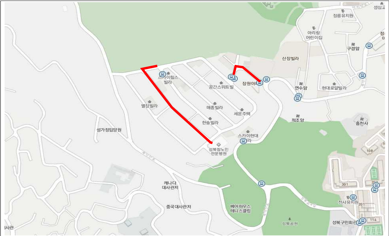
연번 1 : 정릉동 508번지 일대