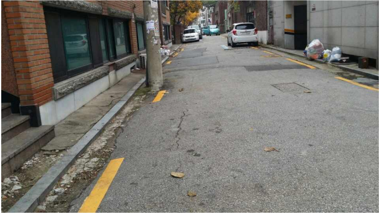
연번 1 : 정릉동 508번지 일대