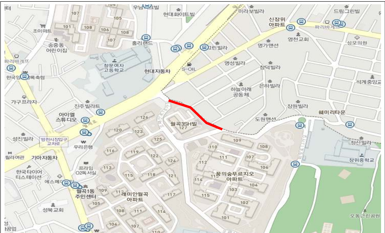
연번 2 : 장위로4길 주변