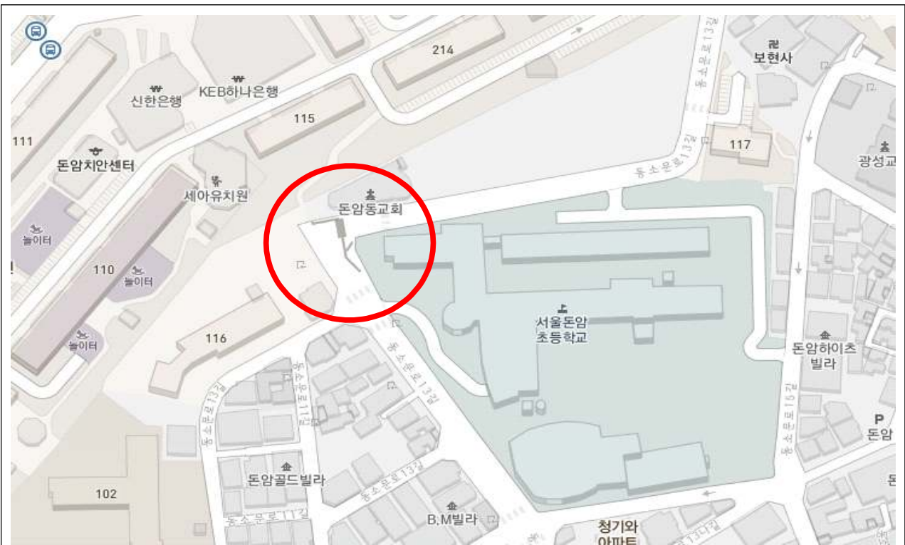
연번 4 : 돈암육교 현황