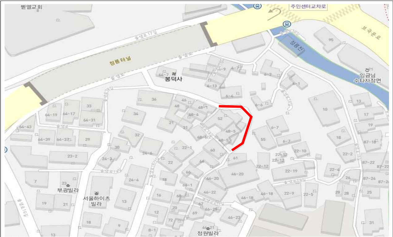
연번 3 : 정릉동 710번지 주변