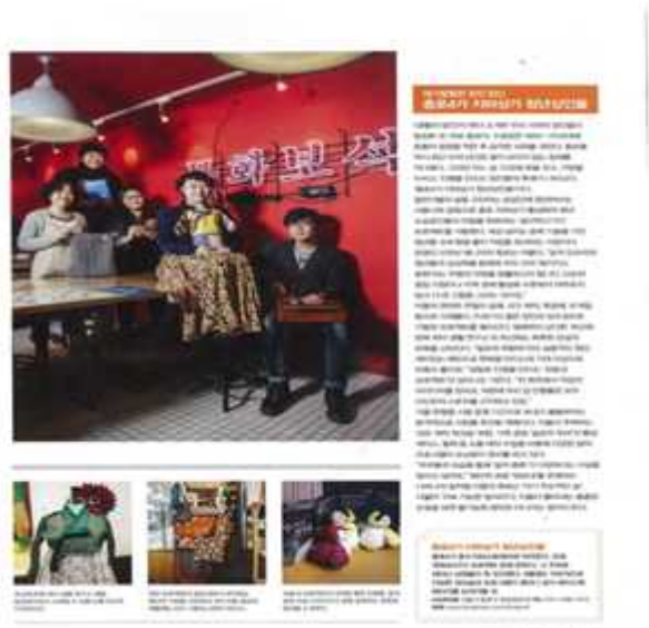
<The Traveller* 기획기사> *국내 최대 발행부수의 여행&라이프스타일 잡지