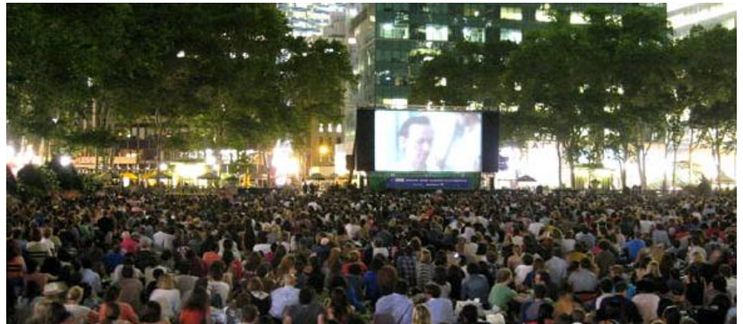
브라이언파크 - 영화상영