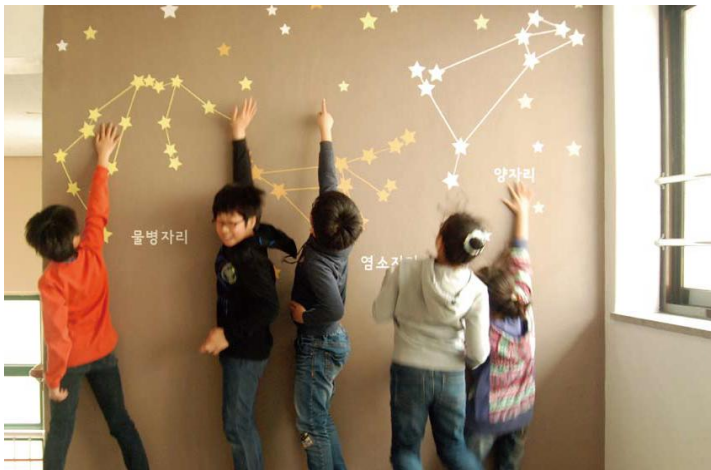
녹촌초등학교 - 컬러테라피