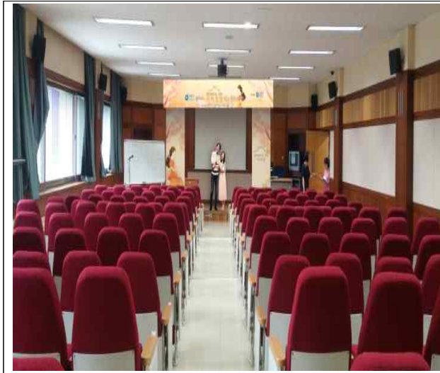
내부 좌석 배치도 안