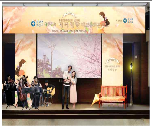
무대 전경 시안