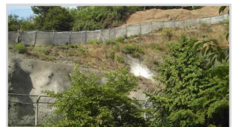
기존 녹지 일부 훼손 (대현산)