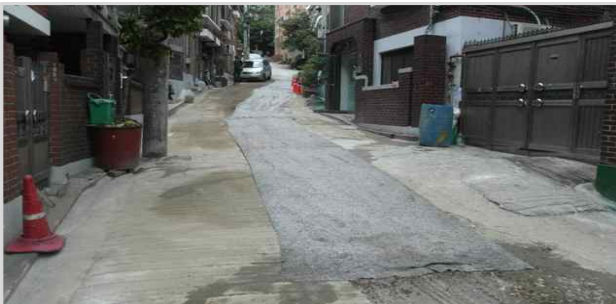
하왕십리 침수방지공사 (상왕십리역 주변)

→ 우기전 하왕십리, 사근빗물펌프장 공사장 하수관로 설치 등 주요 공정 조기 완료 필요