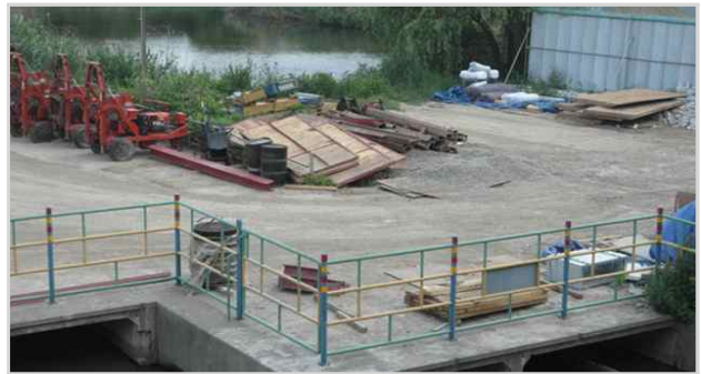
유수지 내 자재 방치(뚝섬빗물펌프장 옆)