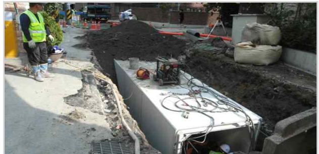
빗물펌프장 유입수로 개선공사 (사근빗물펌프장 앞)