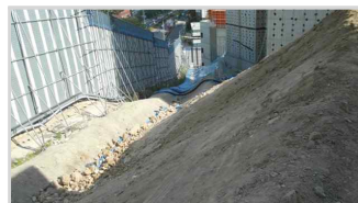
토사법면 천막 미 설치 (옥수13구역)