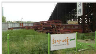
자재 방치 (응봉교 공사장)