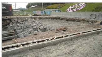
수영장 터파기 공사장 (살곶이 체육공원)