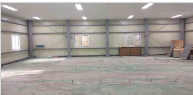
공사 미 완료(송정빗물펌프장 옆 창고)

※ 응급구호세트(담요, 베개, 속옷 등), 취사구호세트(코펠, 수저, 수세미 등)