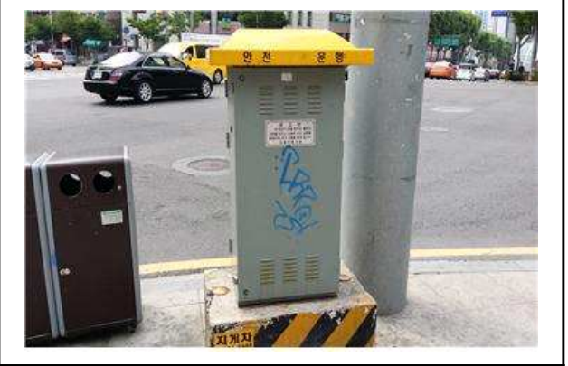
문화체육과 - 삼성로 654 교통신호제어기 낙서