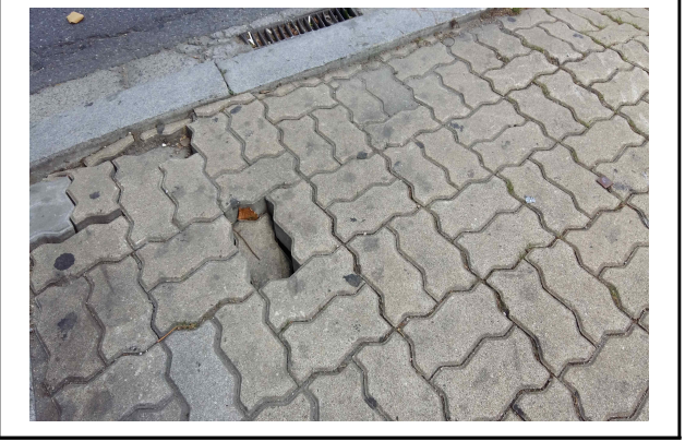
건축과 - 불법주차시설 설치