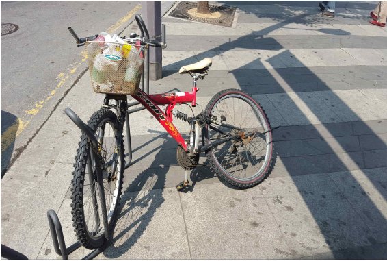
교통정책과 - 강남역 방치자전거