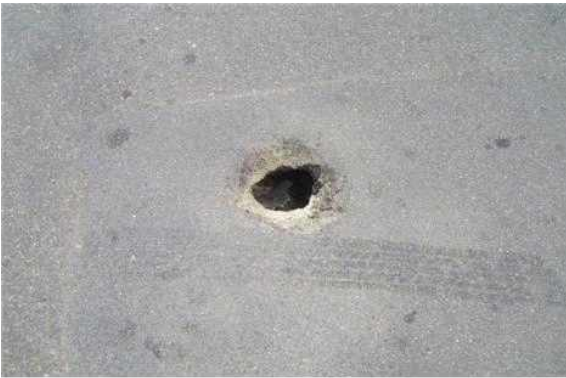
총무과 - 개포동 이면도로 하수관 파손