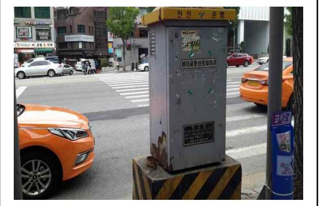
기획예산과 - 도산대로 교통신호제어기 훼손