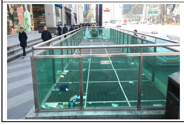
복지정책과 - 강남역 지하철 환기구 정비