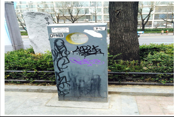
재난안전과 - 가로등 분전함 훼손 적출