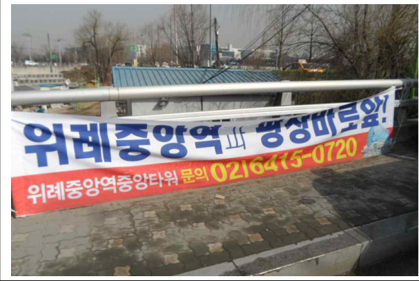
전산정보과 - 자곡로 불법 현수막 정비