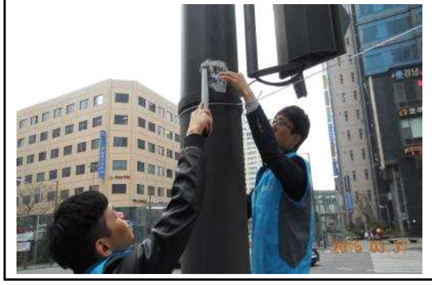
세무2과 - 가로등 불법부착물 제거