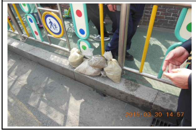
건축과 - 방치된 염화칼슘 정비