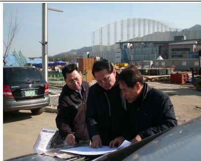
위례 신도시 현장