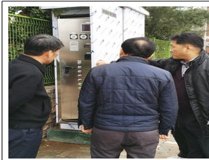
방이 증압장 현장