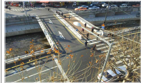
〈 신림3교 가각부 개선 〉