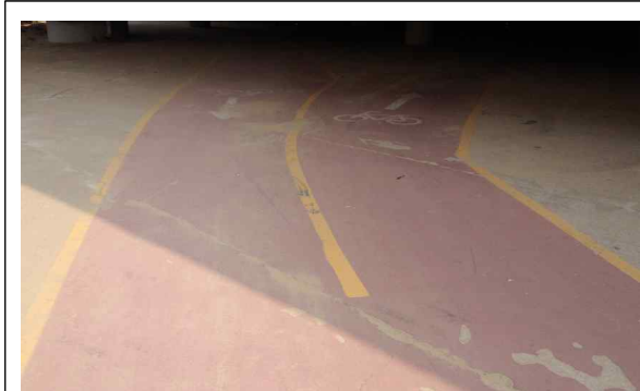
〈 노후 자전거도로 〉