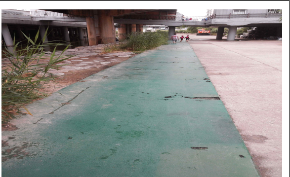
〈 파손 산책로 〉