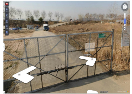
[가 래 여 울]