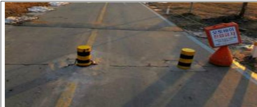
차단장치(볼라드) 설치 장면