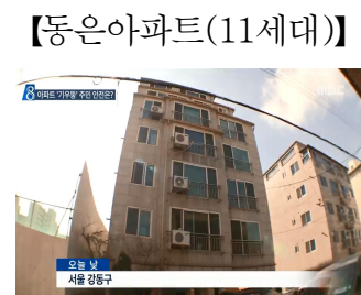
【명성교회 신축현장】 【동은아파트(11세대)】