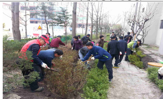
아파트 지원사업 사례