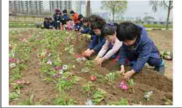
<양천구 안양천둔치 봄꽃 식재행사>