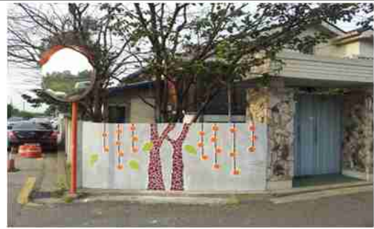
골목길 지원사업 사례(강서구 방화동)