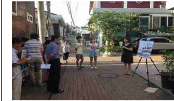
골목길 지원사업 사례(강북구 송중동)