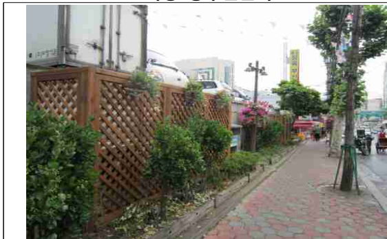
독산동 우시장 상인회