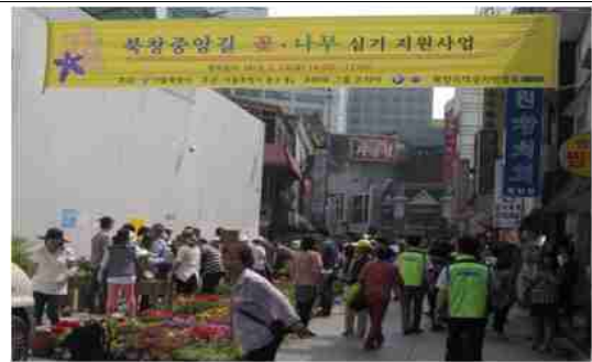
상가 지원사업 사례(북창중앙길)