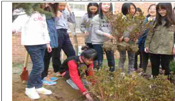
학교 지원사업 사례(마포구 서교초교)