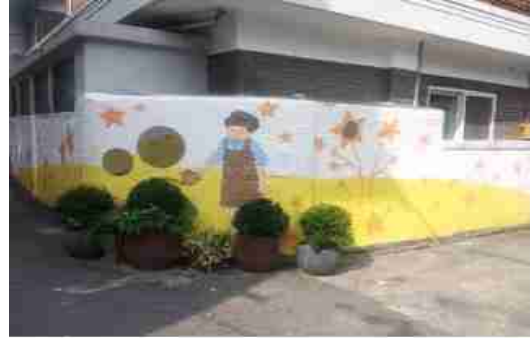
관악구 인헌13길 골목길 주민들