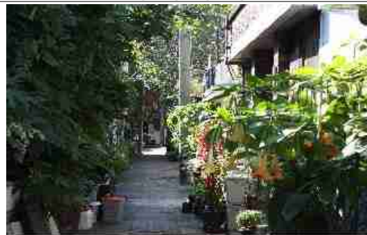
청량리동 37번지 주민들