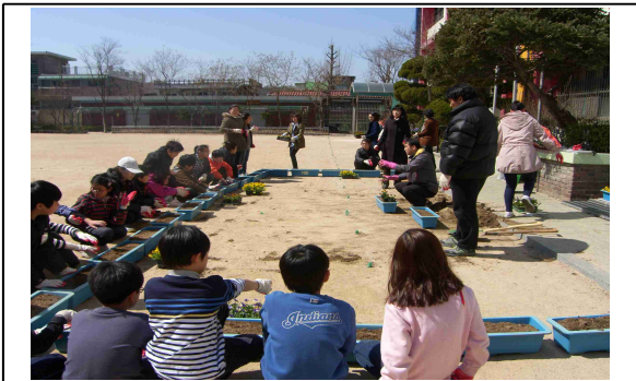
<강서구 학교 봄꽃 지원사업>