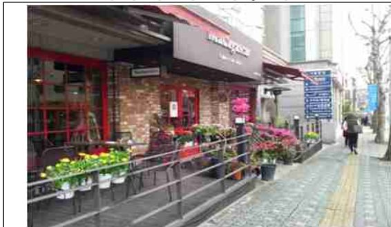
상가 자발적 참여 사례(용산구)