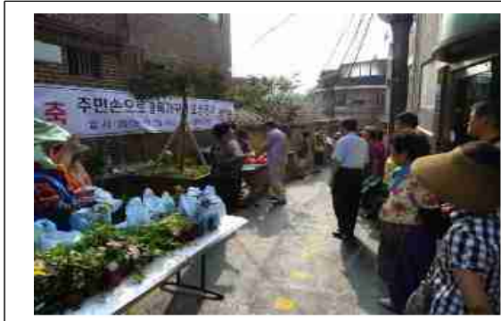
염리동 소금길 주민들