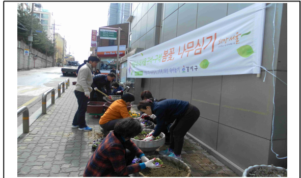
<강서구 봄꽃 나무심기행사>