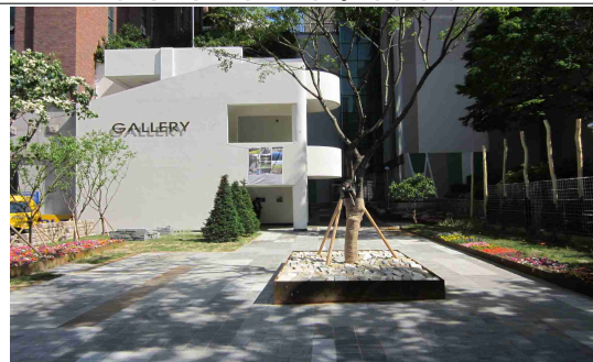
동네 지원사업 사례(성동구 행당동)