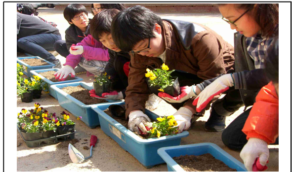
<강서구 학교 봄꽃 지원사업>