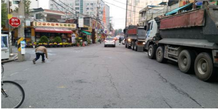
공 사 중