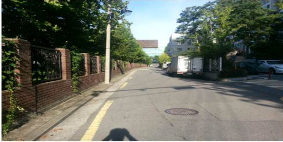
공 사 중