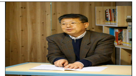
- 업무보고 (경제활성화팀장) -