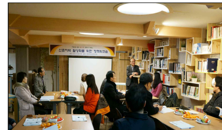
- 특강(경제재정국장) -