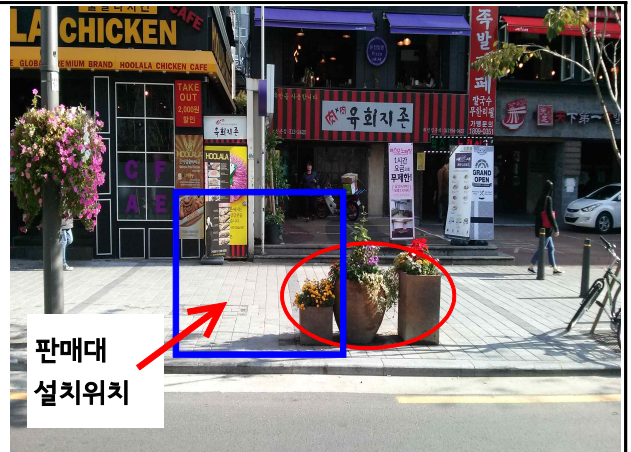
명물길26 앞 화분 이전 필요