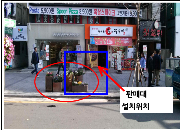
명물길16 앞 화분 이전 필요