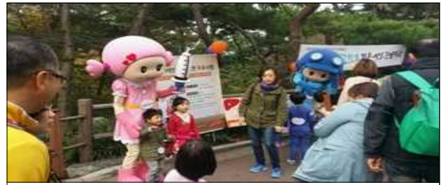
예방접종 홍보 예랑이, 예별이(10.25)