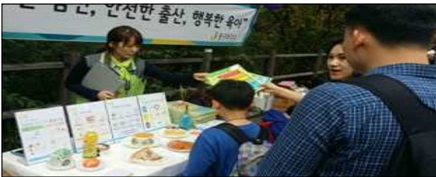
편식예방교육 및 영양상담