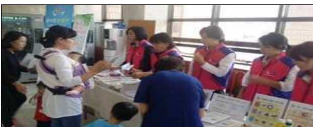
모자보건, 감염병예방 홍보물 배부(10.9)