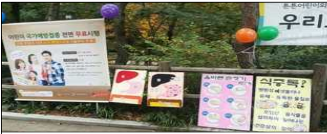
교육 판넬 게시(10.25)