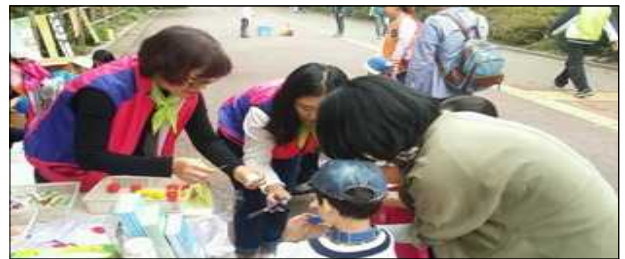
구강관리교육 및 잇솔질 체험