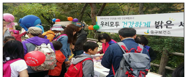
모자보건, 감염병예방 홍보물 배부(10.25)