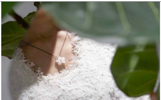
착용 사진 2