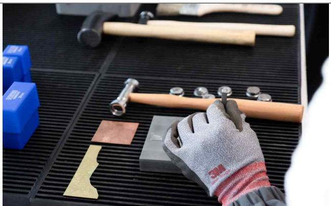
금속공예 작업 과정