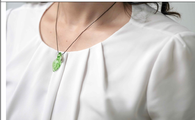
착용 사진 1