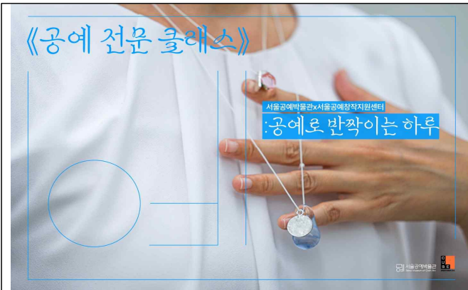
〈공예 전문 클래스〉 포스터