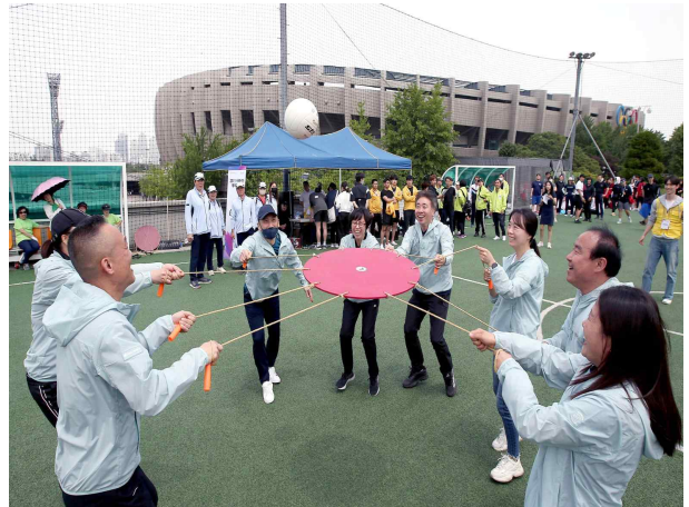
< 시민 참여 종목 >