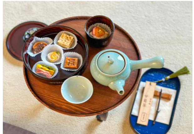
&lt; 경복궁 생과방 체험 &gt;