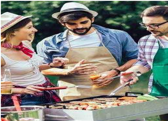
<셀프 바비큐 구이>