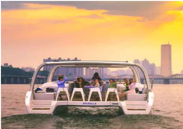
&lt; 한강 요트 체험 &gt;