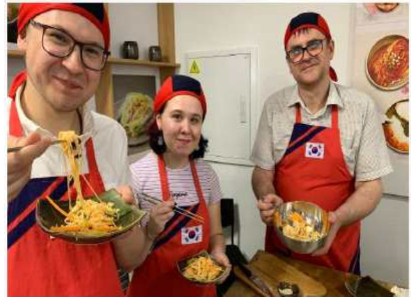
<겉절이 만들기 체험>