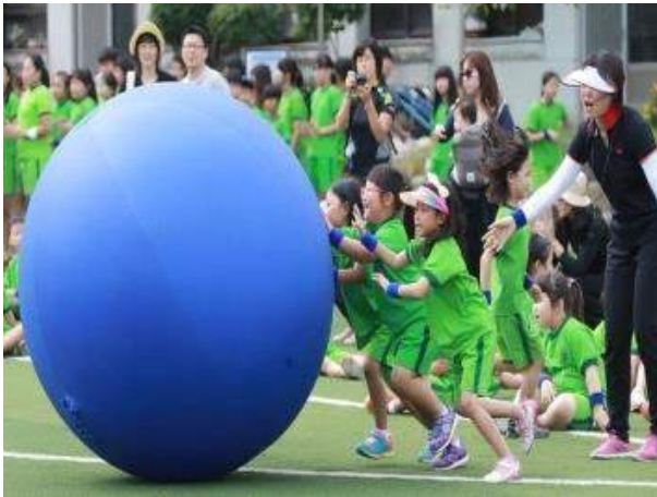
< 유아 참여 종목 >