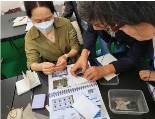
<곤충 교육 관련 실습>