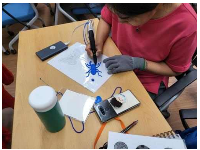
<곤충 교육 관련 실습>