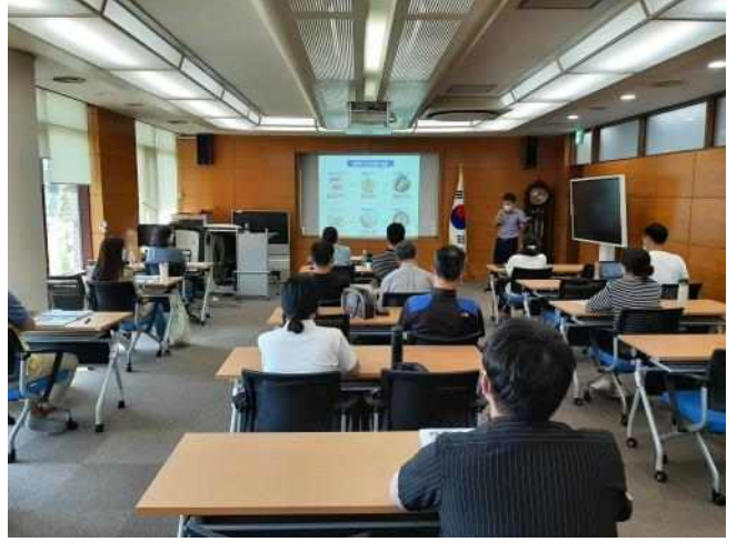
<곤충 이론 강의>