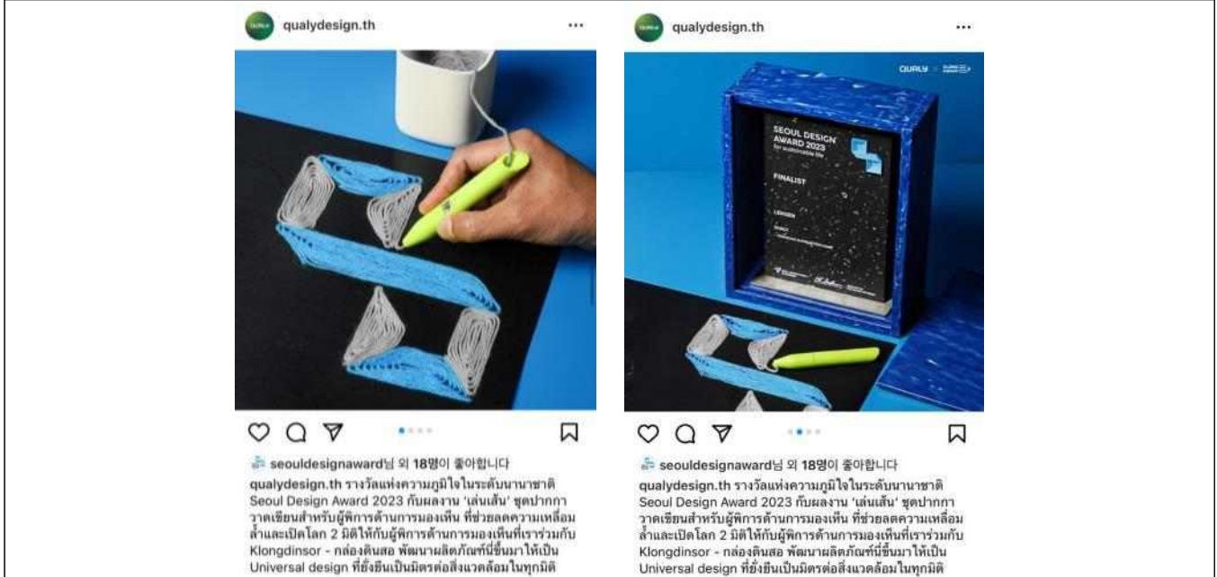
3. 태국의 수상제품 ‘렌센(시각장애인을 위한 드로잉 키트)’으로 어워드의 로고를 만들고, 트로피와 수상 소감을 함께 SNS에 게재한 이미지. @qualydesign.th (https://www.instagram.com/p/C0lvQU_L2m-/?utm_source=ig_web_button_share_sheet&igsh=MzRIODBiNWF1ZA=)