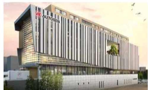
< 투시도 >