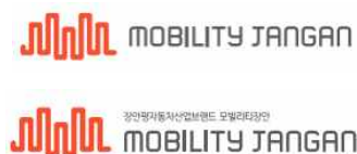
< 브랜드 활용형 (영문) >