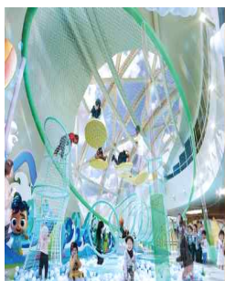
시립 독섬자벌레 (891㎡, '24.3월 개관)