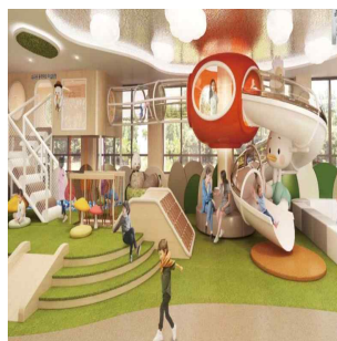
시립 보라매공원 (335㎡, '24.하반기 개관)