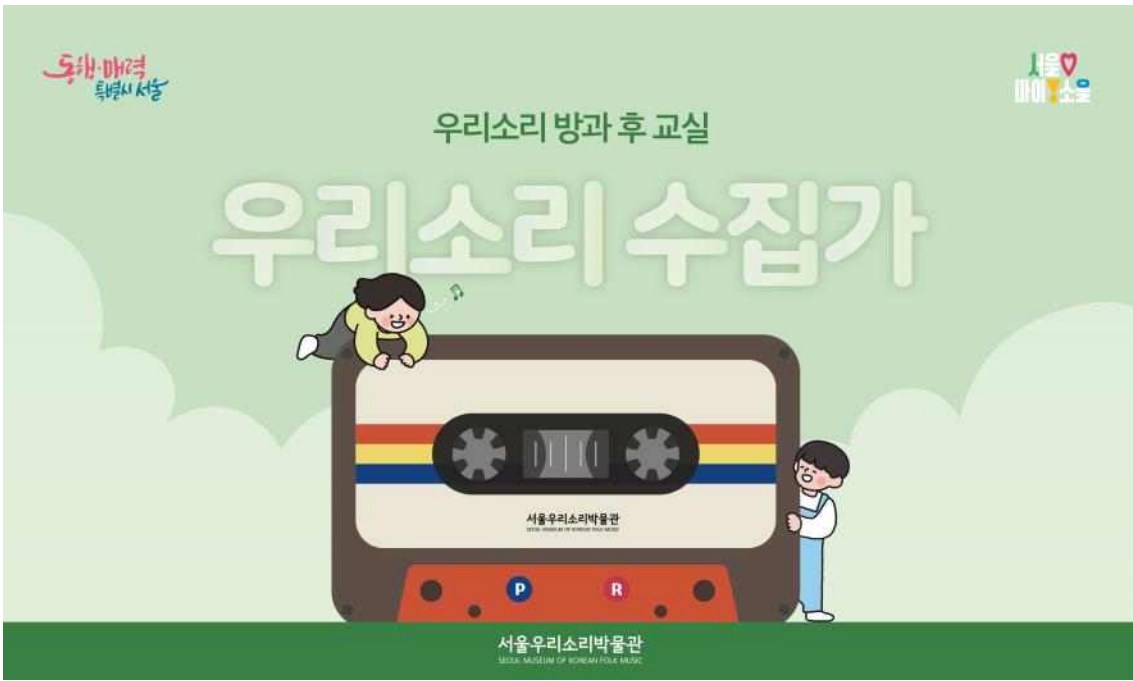
[사진 1] 서울우리소리박물관 방과 후 프로그램 <우리소리 수집가> 배너