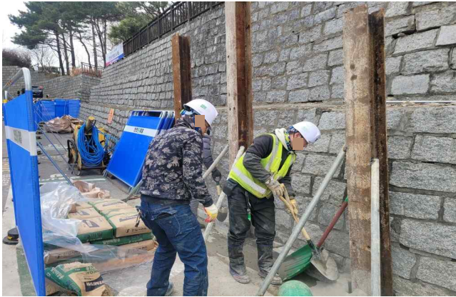
다산성곽길 임시조치 공사