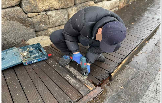
한양도성 탐방로 데크 보수