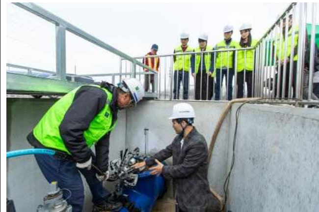
▲ 상수도관 세척 시연을 참관하는 교육생들