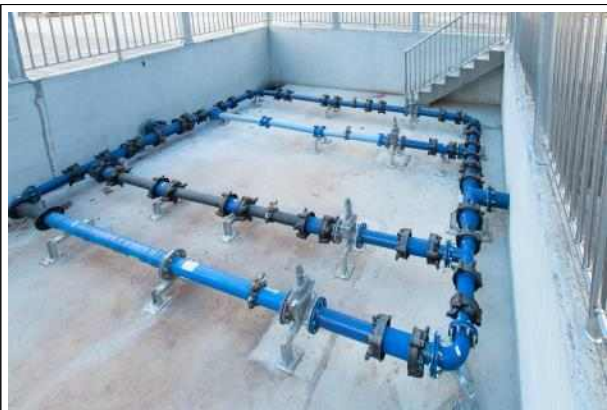
상수도관 수선·접합 실습장