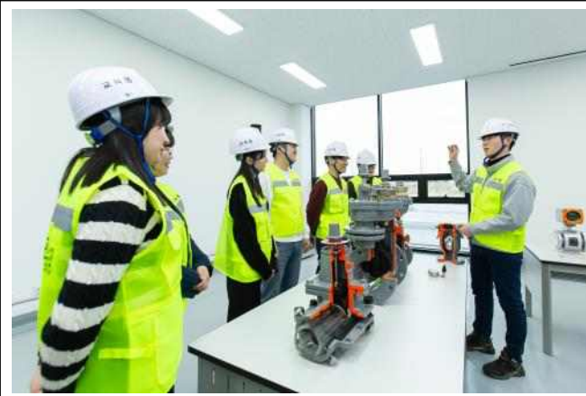
▲ 상수도 자재(밸브) 내부 구조와 작동원리 이해 교육