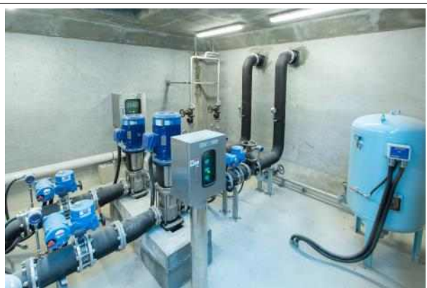
낮은 곳의 물을 끌어 올려 주는 증압장 실습장