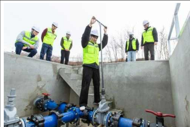
▲ 상수도관 직접 밸브 조작 실습 교육