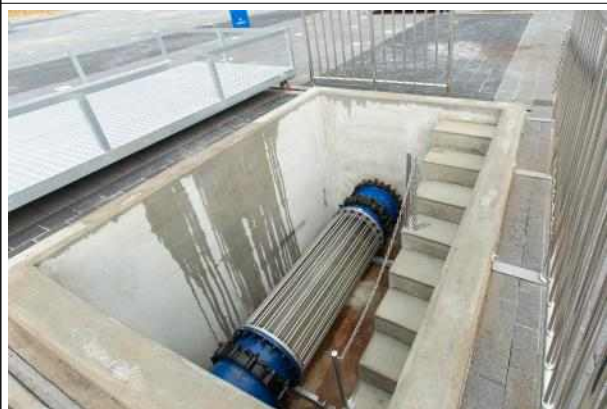
수도관 내부를 관찰할 수 있는 투명관