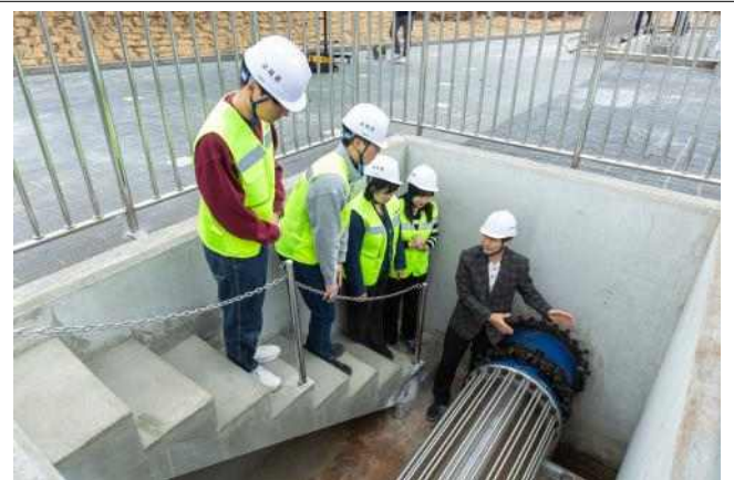
▲ 특수 제작된 투명관을 통해 관 내부 물 흐름 변화를 관찰 중인 모습