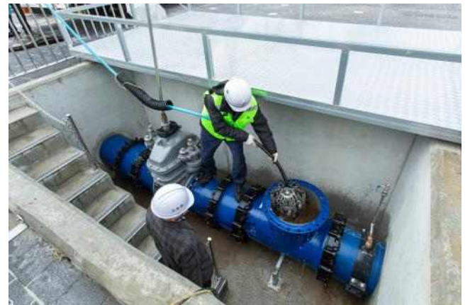
▲ 상수도관 세척 시연