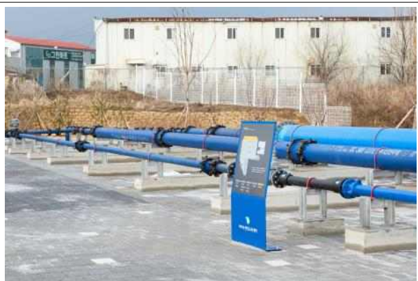
지상에 마련된 관로 실습장