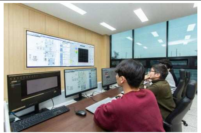
▲ 수도시설 원격 제어시스템 구동 방법 실습