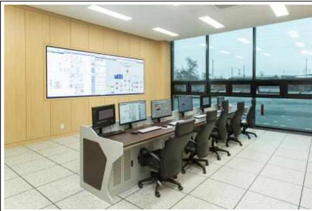
상수도 시스템 제어 실습장