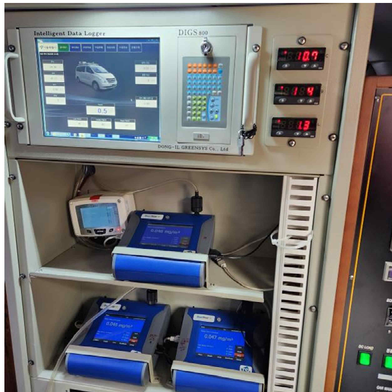
측정 시스템 내부