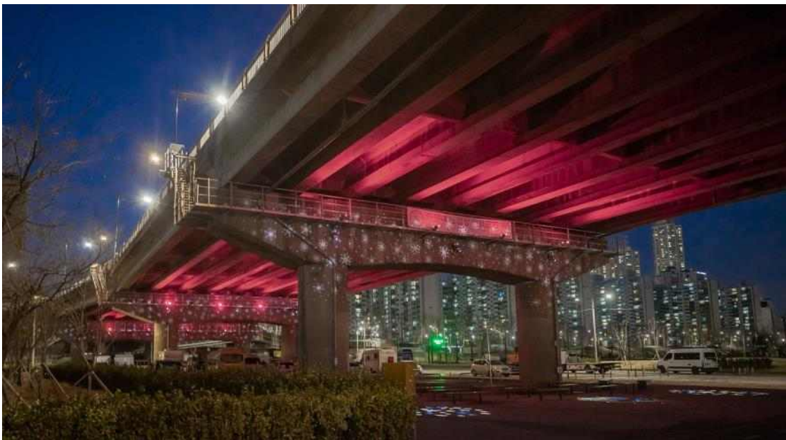
안양천 신정교 서측(양천구 구간) 경관조명