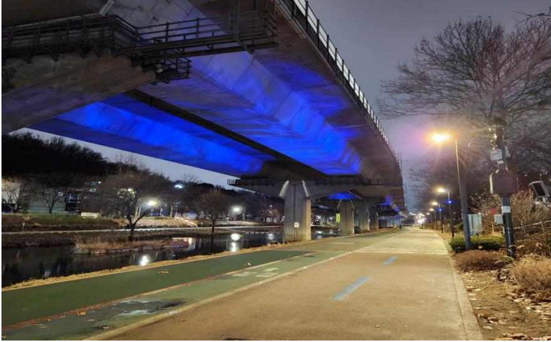
홍제천 내부순환로 하부 연출조명 및 보행로 밝기 개선