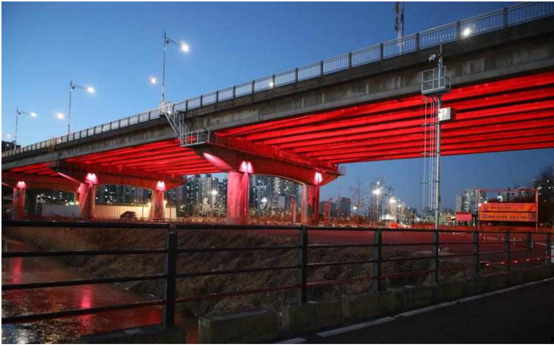
안양천 신정교 동측(영등포구 구간) 경관조명