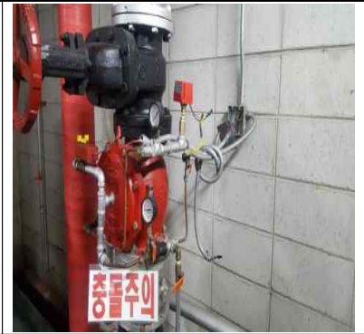
잠실주차장 기계실 케이블 접속함 전선 마감 필요