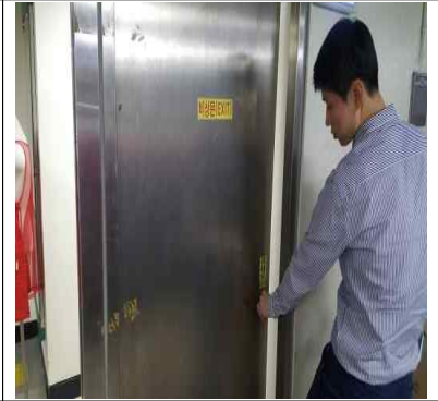
동대문지상상가 방화셔터 비상출입구 개폐방법 개선