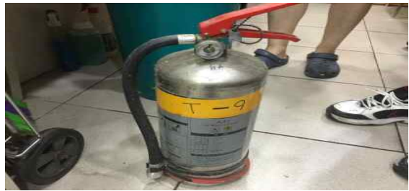
분기별 화재예방 교육 시 K급 소화기 사용교육 실시