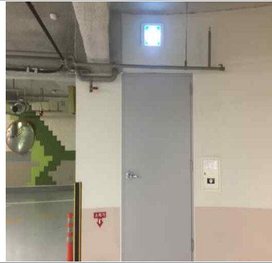
글로벌센터 방화셔터 비상출입구 개폐방향 개선