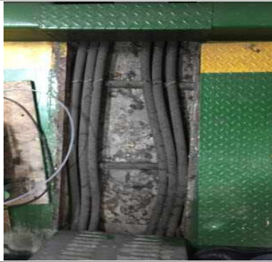
영등포지하도상가 전기실 1차 인입케이블 노후