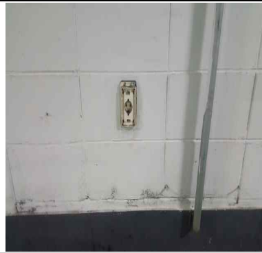
잠실주차장 B1층 벽면 미사용 전기콘센트 제거 필요