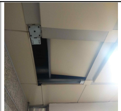
시립승화원 유족대기실 천정판넬 보수