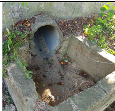
석축 배수집수정 준설