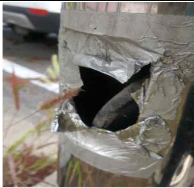
개화산주차장 CCTV 등주 점검커버 누락