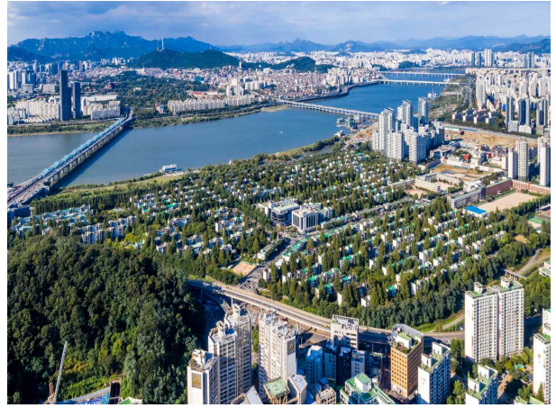
2020년대 반포동과 잠원동