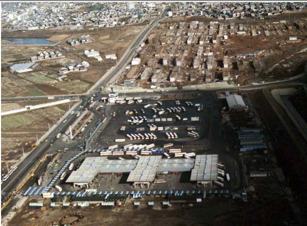
1977년 고속버스터미널