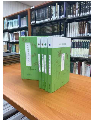
《서울 동의 역사》 도서 이미지