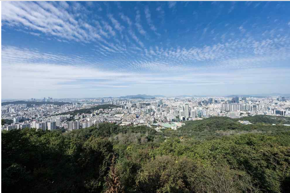
오늘날 서초구 전경