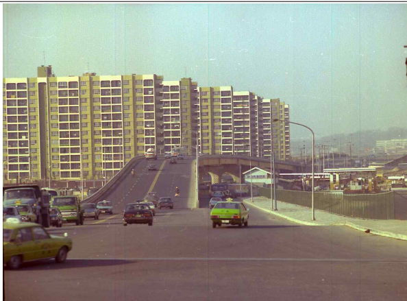
1970년대 강남터미널고가차도