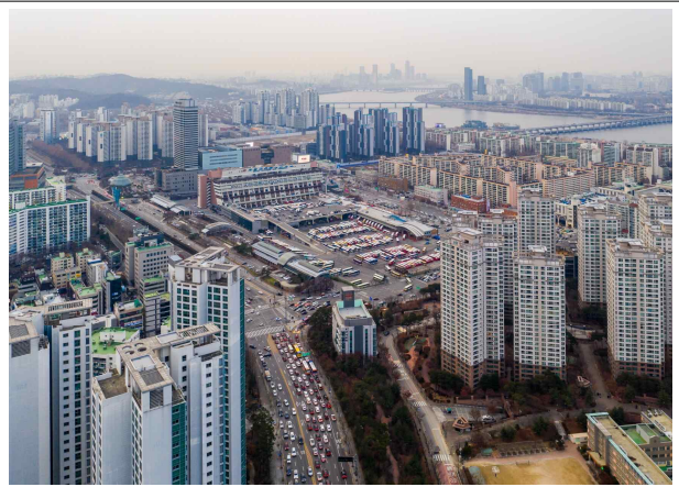
2020년대 고속버스터미널